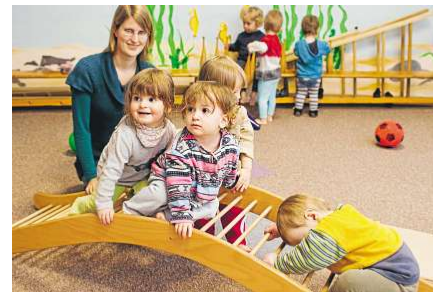
7,36 Millionen werden für Krabbelstuben ausgegeben.