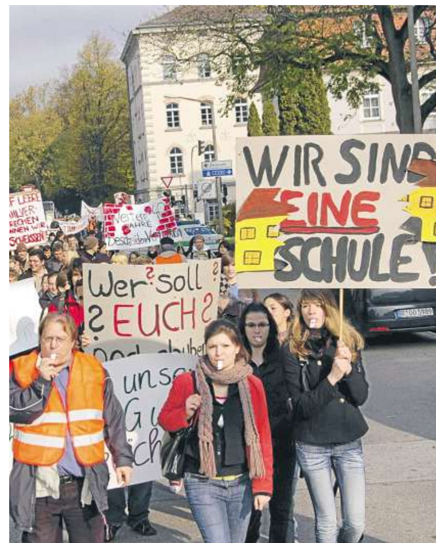
Die Schüler der FOS/BOS (linkes Foto) müssen noch auf einen Neubau warten. Mit der Osttangente (rechts) kann es jetzt weitergehen.