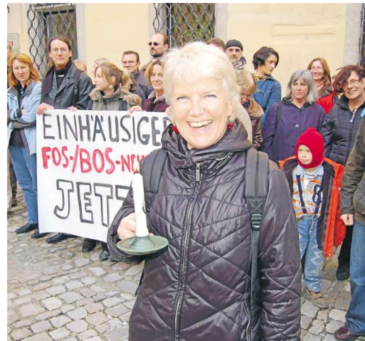
Mit Mahnwachen kämpfen Eltern, Lehrer und Schüler um den Neubau der Schule auf Stadtgebiet.

Der Landkreis fordere vielmehr weiterhin anonymisierte Daten mit